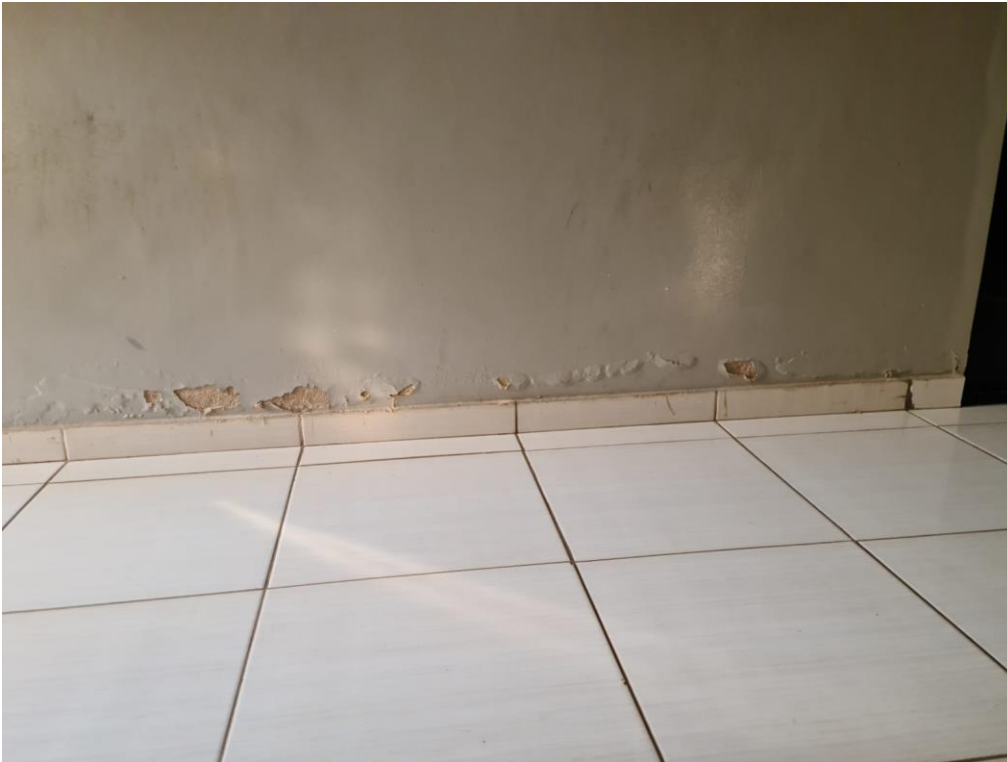
Foto 11 – Imagem de patologias na base das paredes em decorrência de umidade.