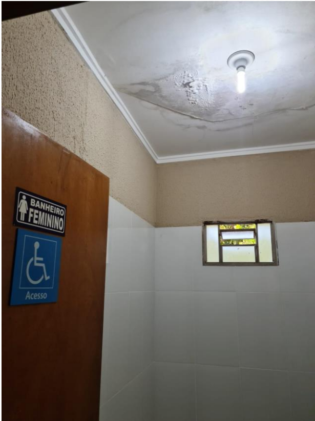
Foto 14 – Imagem do forro com sinais de infiltração no teto do banheiro feminino.