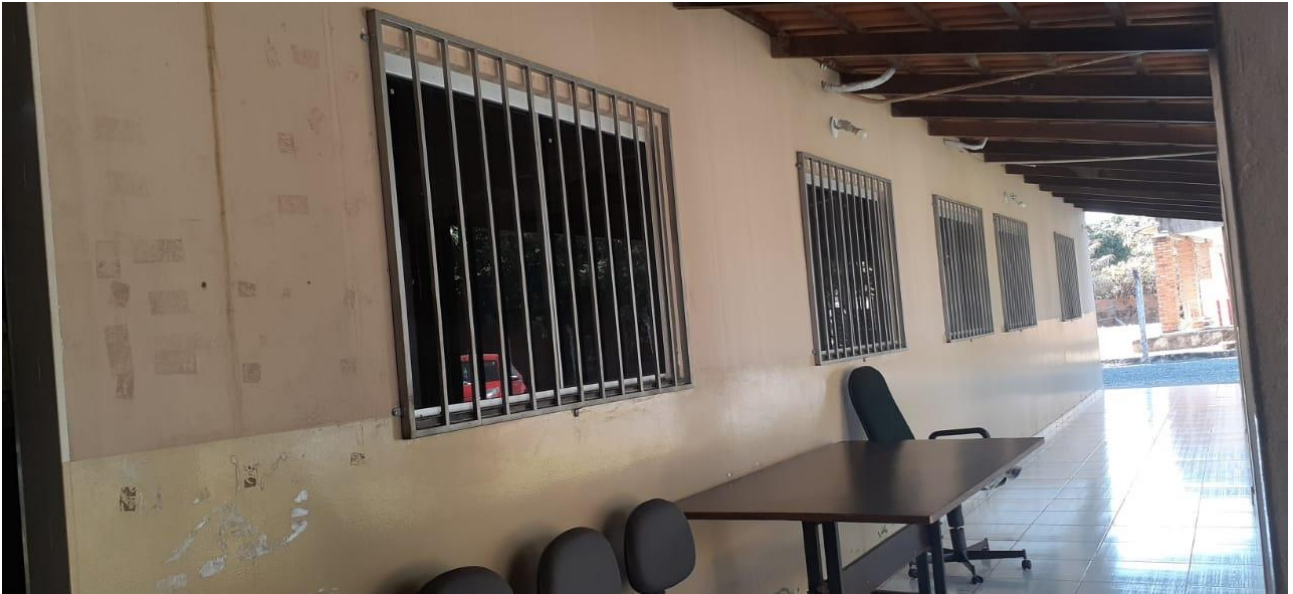
Foto 22 – Imagem da fachada e da varanda externa coberta da edificação.