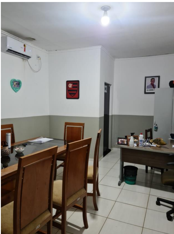
Foto 15 – Imagem do gabinete da presidência da Câmara dos Vereadores de Aruanã.