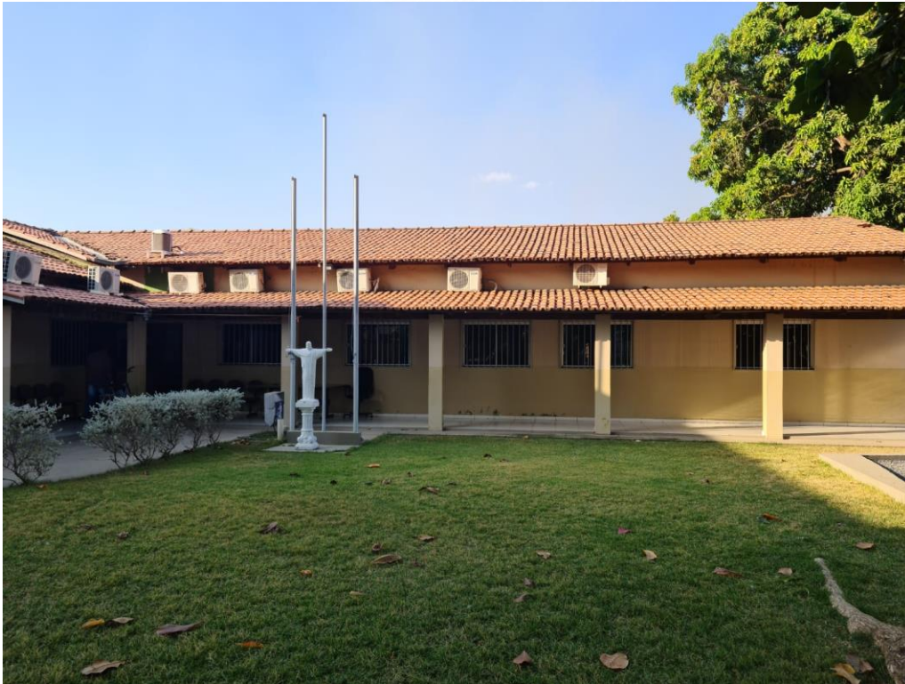
Foto 01 - Vista do setor administrativo e de gabinetes da Câmara dos Vereadores do Município de Aruanã-GO.