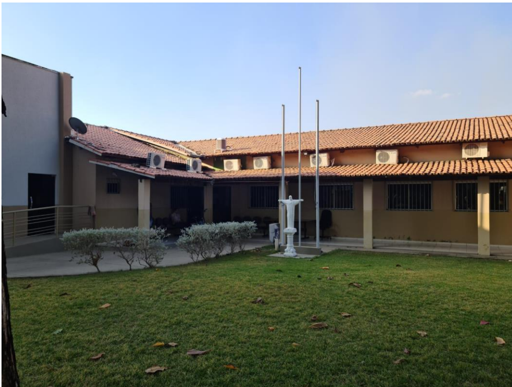
Foto 02 - Vista do setor administrativo e de gabinetes da Câmara dos Vereadores do Município de Aruanã-GO.